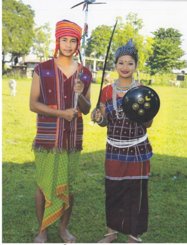
মায়তৰি ভাষাৰ ডেকা-গাভুৰু