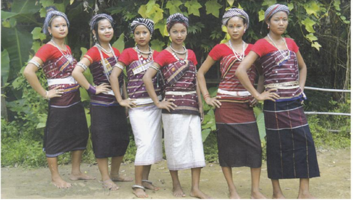
পুৰণি মায়তৰি গাভৰু