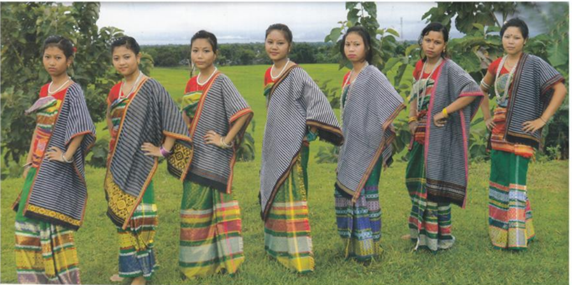
আধুনিক মায়তৰি গাভৰু