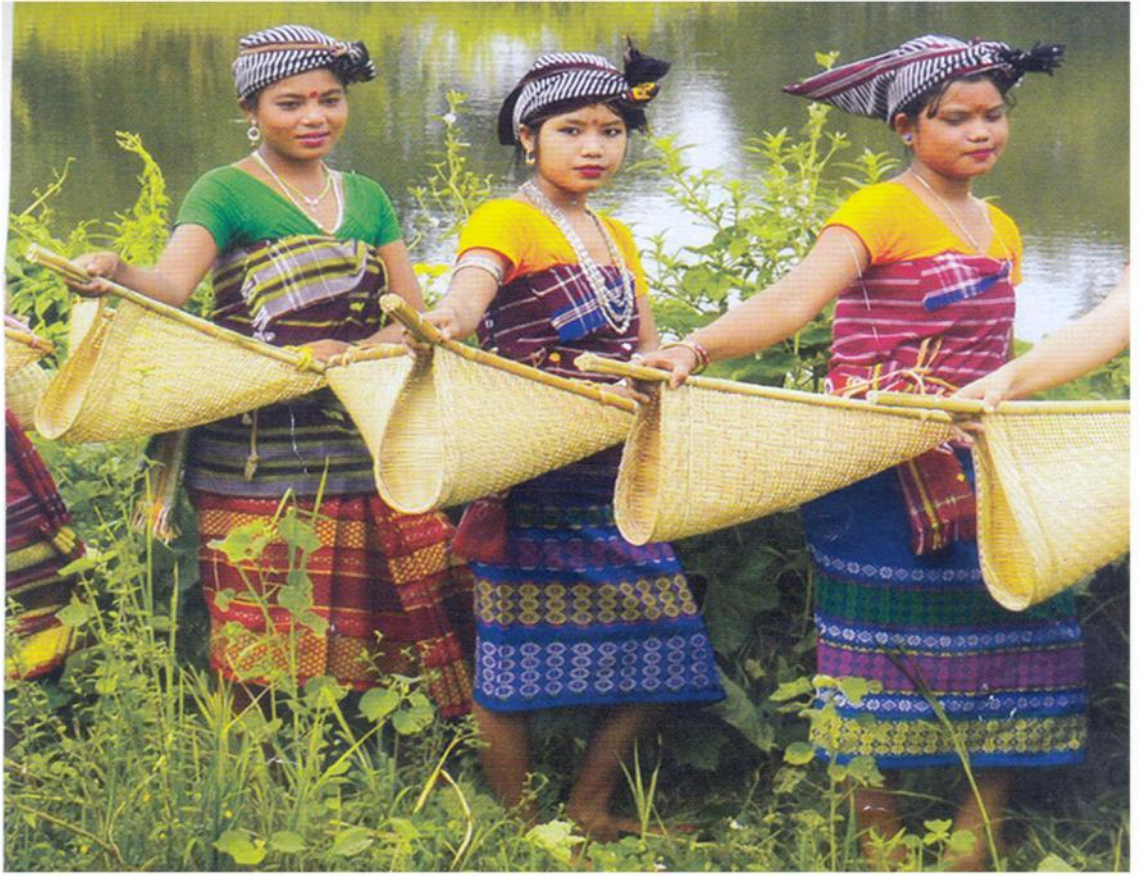
মাছলৈ যোৱা দৃশ্য