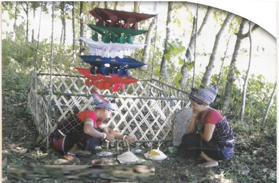
মায়তৰি ৰাভাৰ মৰিশালী