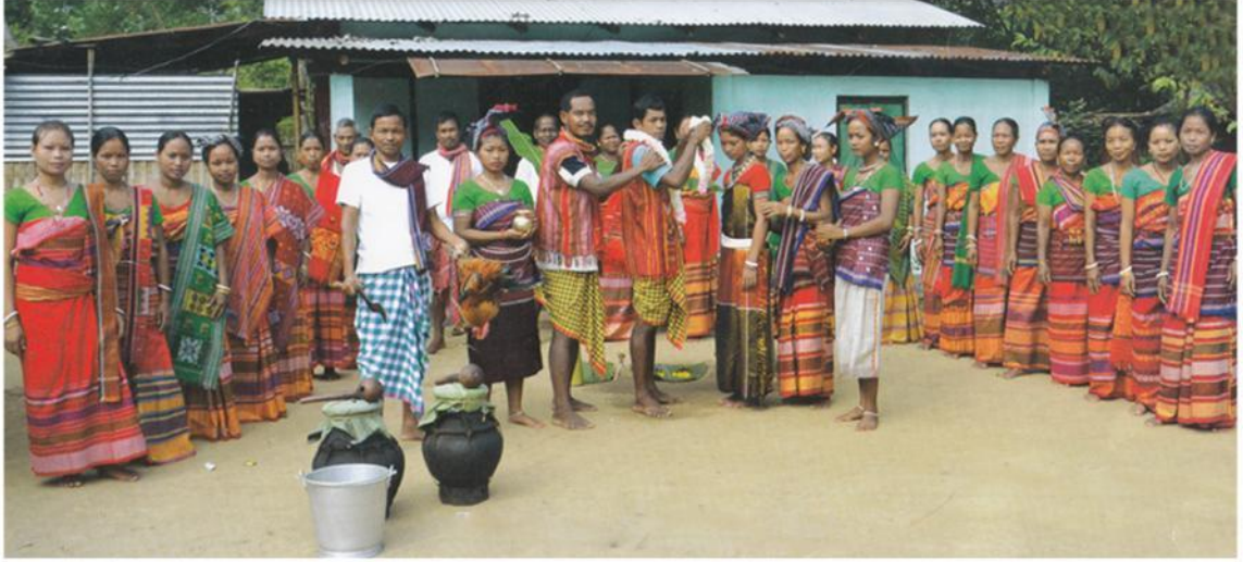
মায়তৰি ৰাভাৰ বিয়া