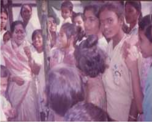
মুখত পিঠাগুড়ি সনা দৃশ্য