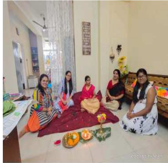
মহানগৰীত অনুষ্ঠুপীয়াকৈ পতা তোলনি বিয়া (গুৱাহাটী)