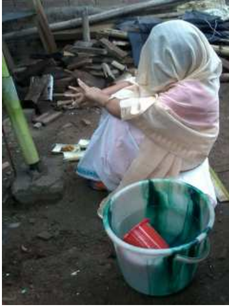
গা ধোৱা স্থানত কইনা