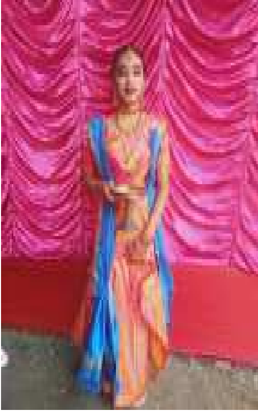
তোলনি বিয়াৰ কইনা