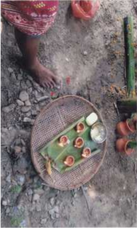
ৰাজবংশী সমাজৰ কইনাক ধুওৱা স্থানত থোৱা চালনী বাতি (কোকৰাঝাৰ)