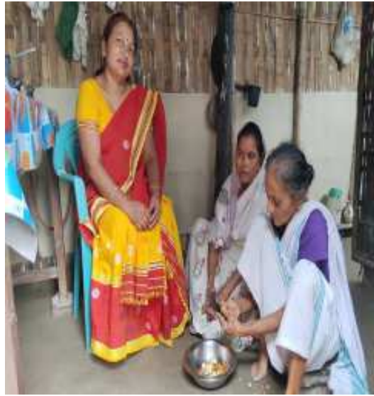
সোঁফালৰ পৰা ক্ৰমে- নানৌ চহৰীয়া, নিৰদা চহৰীয়া, গাদলু চুৰা (দৰং)