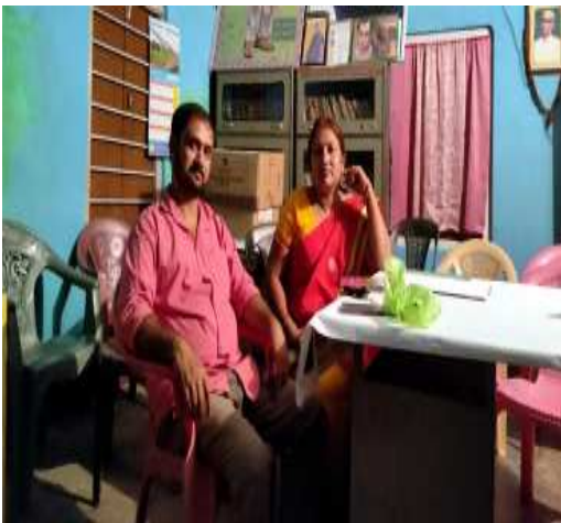
দৌলগুৰি জ্ঞানোদয় পুথিভঁৰালত গ্ৰন্থগাৰিকৰ সৈতে, দৌলগুৰি (দৰং)