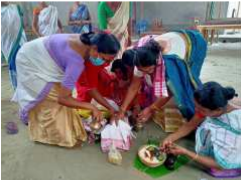
পানী তুলিব যোৱাৰ আগমুহূৰ্তত