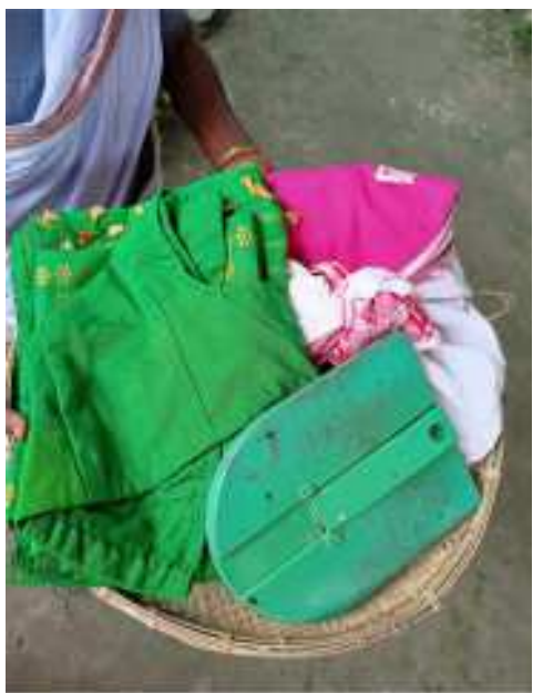
কইনাক পিন্ধাৰৰ বাবে থোৱা কাপোৰ