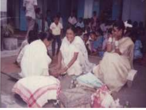
আঁখে বাতি টনা-টনি (দৰং জিলাৰ নাথ সম্প্ৰদায়)