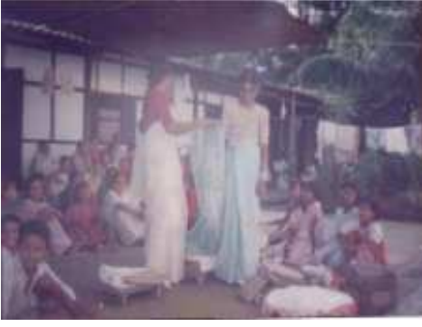
সজাই থকাৰ মুহূৰ্ত