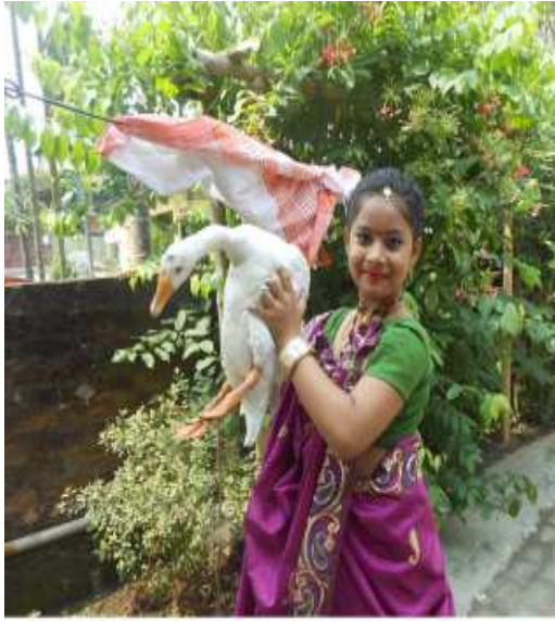
দোষ খণ্ডনৰ বাবে দেখুৱাবলৈ অনা ৰাজহাঁহৰ সৈতে কইনা