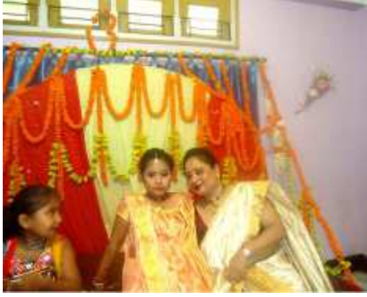
তোলনি বিয়াৰ আধুনিক সাজ-সজ্জা