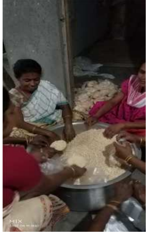
বৰ্তমান সময়ত আখৈৰ সলনি মুড়ি