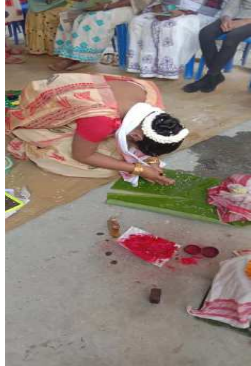
কইনাই আয়তীৰ ওচৰত সেৱা লোৱাৰ সময়ত