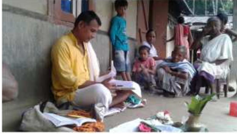
গণনা কৰি থকাৰ মুহূৰ্ত