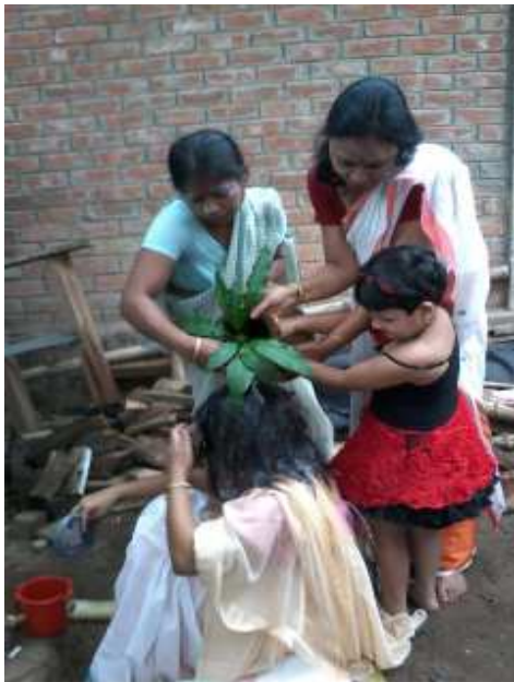
কইনাক ঘটৰ পানীৰে শুচি কৰাৰ সময়ত