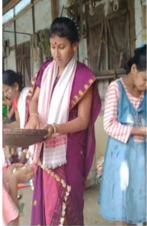
কইনাই আঁখে বিলোৱা