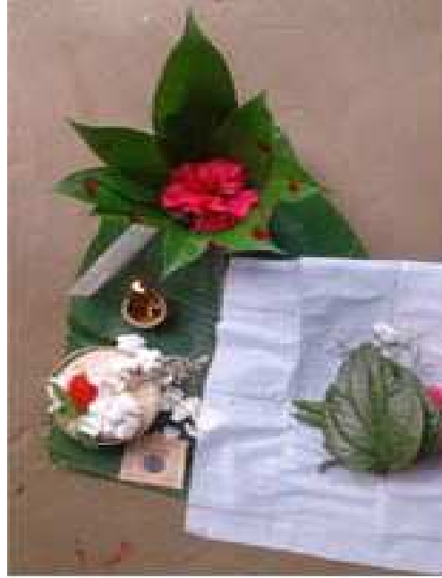
দুগৰি আৰু ঘট