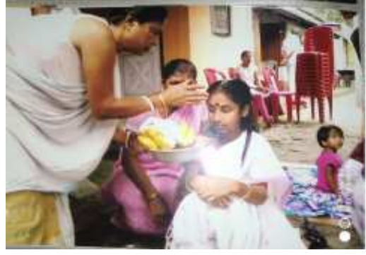
কইনাক কোচত ফল দিয়াৰ সময়ত (কোকৰাঝাৰৰ নাথ সম্প্ৰদায়)