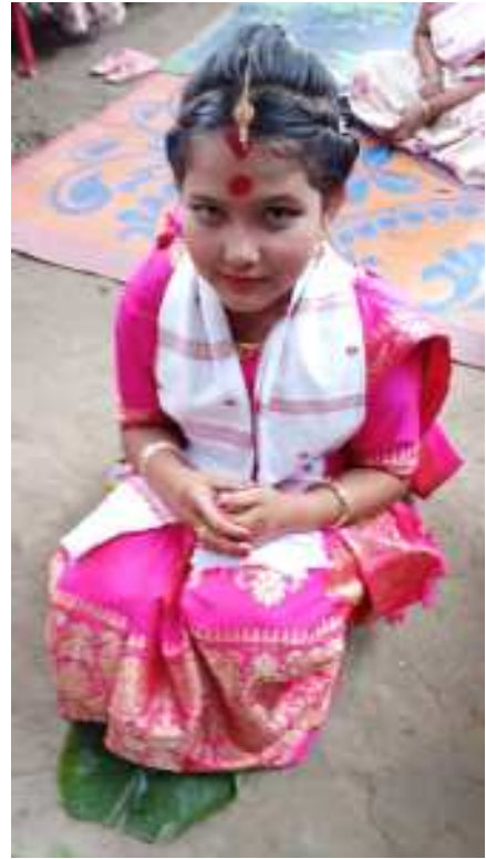
তোলনি বিয়াৰ কইনা