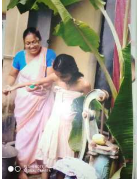
গা ধুৱাই থকা সময়ত