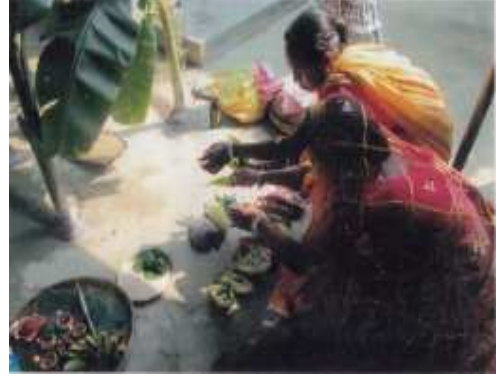
ৰাজবংশী সমাজত কইনাই কৰা পূজা (কোকৰাঝাৰ)