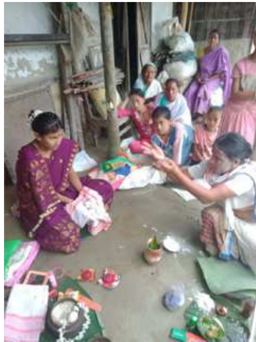
আগ চাউল চটিওৱা