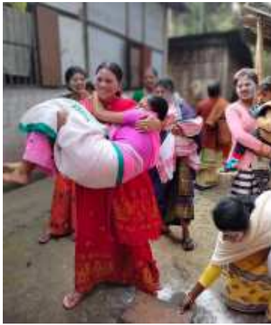
কইনাক গা ধুৱাব নিয়াৰ সময়ত