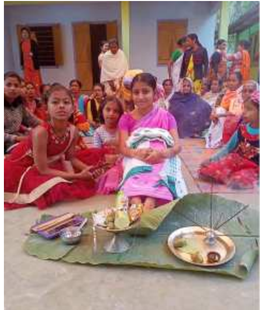
কইনা সজোৱাৰ আগত