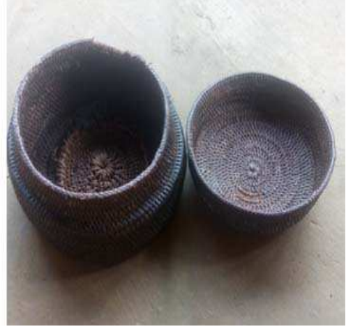
জননী লৈ অহা জপা (খোলা অৱস্থাত)