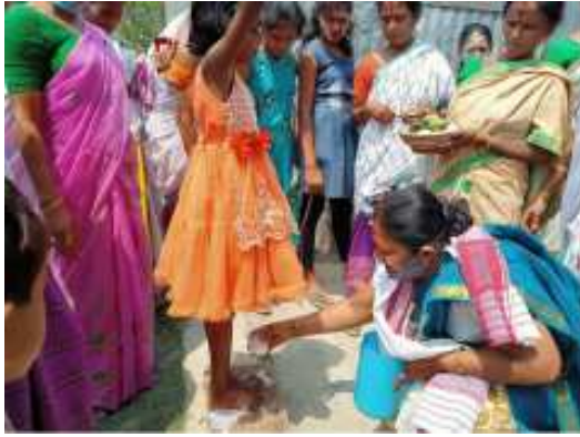
দৰাক ভৰি ধুওৱা অৱস্থাত