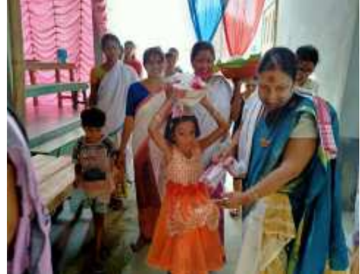
বা দি দৰাক আগবঢ়াই আনোতে