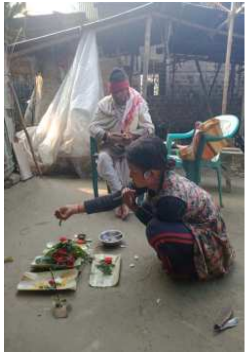
পৰাচিত হৈ থকা অৱস্থাত