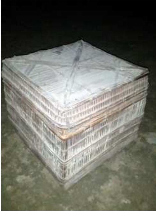
কাপোৰ খোৱা জপা