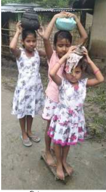
জননি লৈ অহা অৱস্থাত