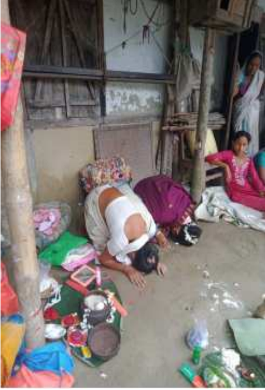
কইনাৰ স'তে মাকে আয়তীৰ ওচৰত সেৱা লোৱাৰ সময়ত