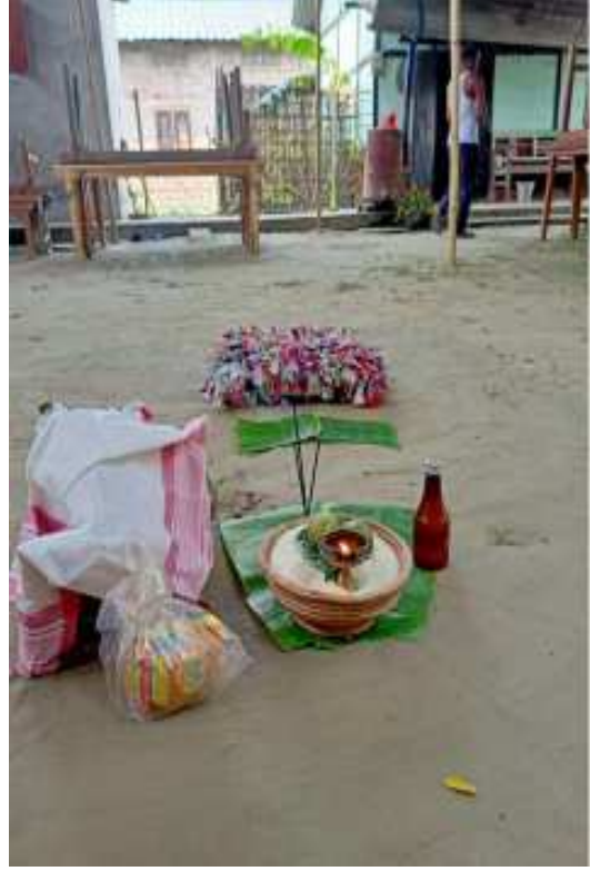
কইনাক চোতালত বহুৱাবলৈ পতা আসন