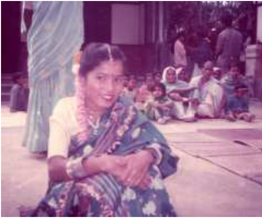
তোলনি বিয়াৰ কইনা