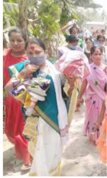
বিয়া ঘৰত ধেমালি (কইনাৰ আত্মীয়ক বিভিন্ন বস্তুৰে পিন্ধোৱা মালা)