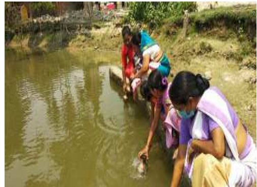
পানী তুলি থকা অৱস্থাত