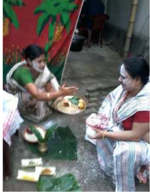
মুখত পিঠাগুড়ি সনা দৃশ্য