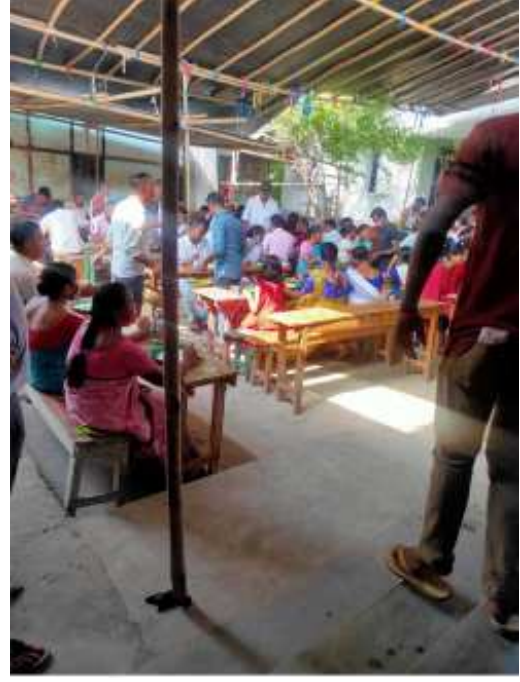
তোলনি বিয়াৰ আপ্যায়ন