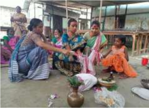
জননি লৈ থকা অৱস্থাত