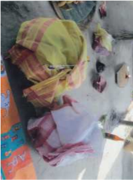
ৰাজবংশী সমাজৰ ৰাপাবুপা (কোকৰাঝাৰ)