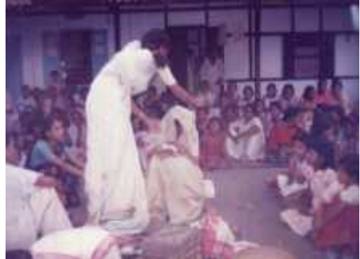
কইনাৰ মূৰত আগ চাউল দিয়া