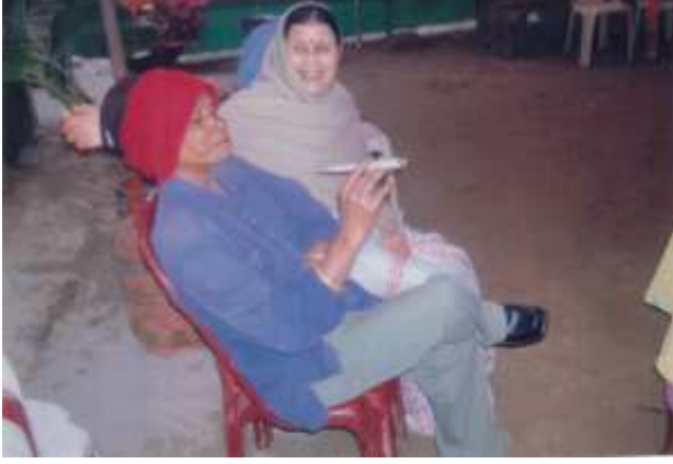
বিয়া ঘৰত ধেমালি (পুৰুষৰ পোছাকত আৰু হাতত চিগাৰেট লৈ আইতা)