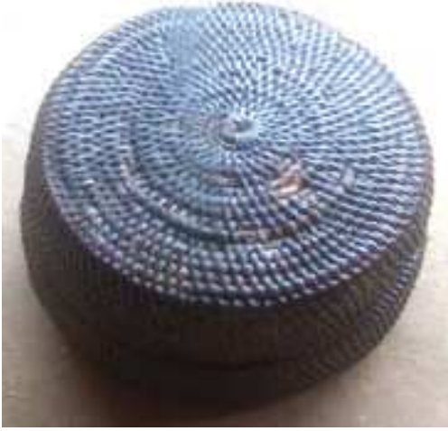
জননী লৈ অহা জপা (বন্ধ কৰি থোৱা অৱস্থাত)