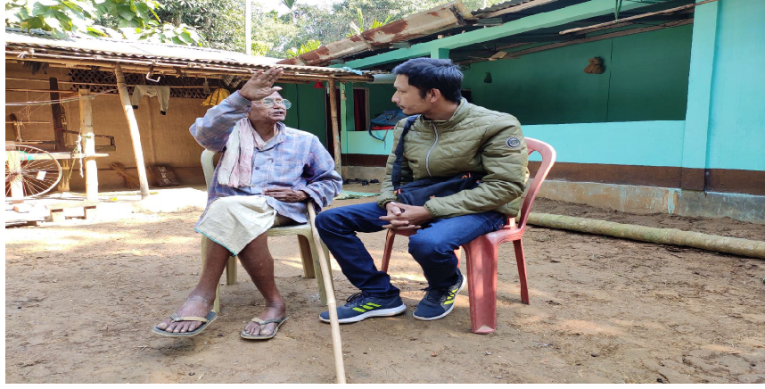
চিত্ৰ—৭ সাধুকথা সংগ্ৰহৰ সময়ত গৱেষক স্থানঃ শগুনবাহী, গোৱালপাৰা