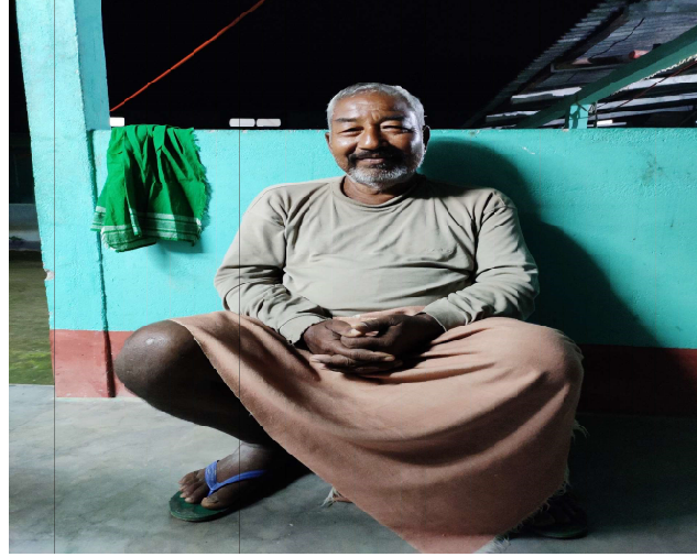
চিত্ৰ—৮ স্থানঃ ধাউলীগুৰী, কোকৰাঝাৰ