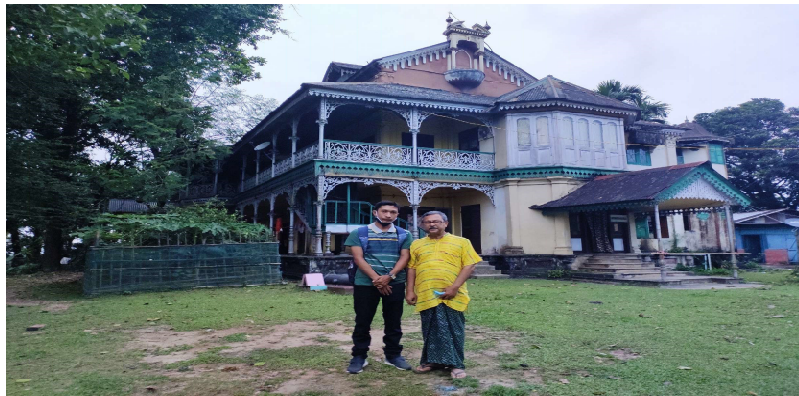
চিত্ৰ—৩ স্থানঃ গোবীপুৰ, ধুবুৰী