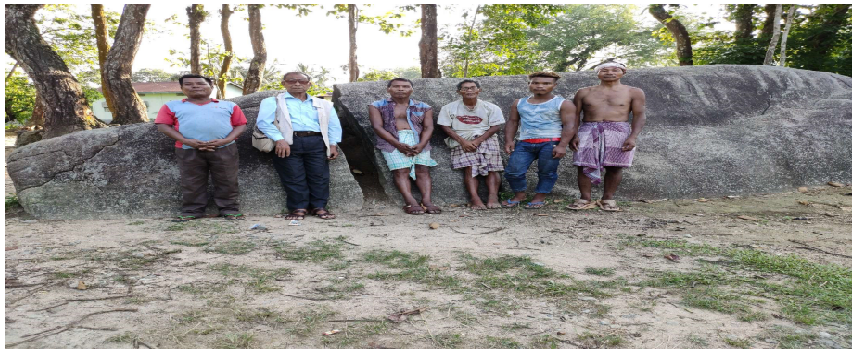
চিত্ৰ—৯ ভাৰুৱাকাটা শিলাখণ্ড স্থানঃ বঙাঈগাঁও