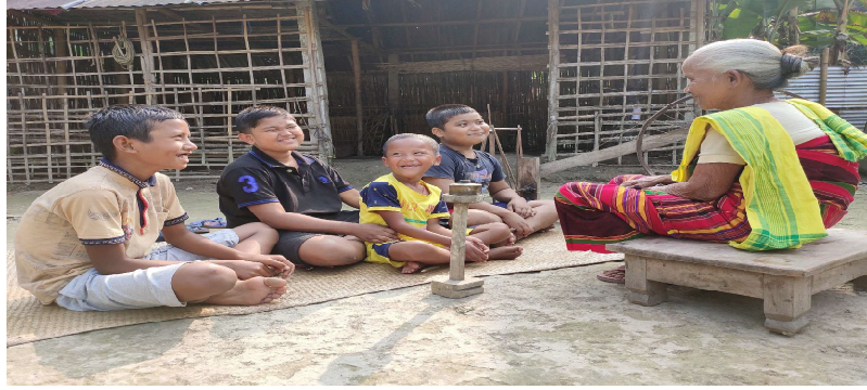
চিত্ৰ—১ স্থানঃ দক্ষিণ ডিমল গাঁও, কোকৰাঝাৰ