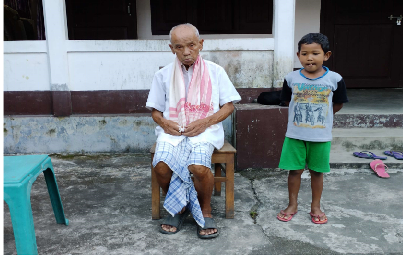
চিত্ৰ—২ স্থানঃ পুৰণি বঙাঈগাঁও