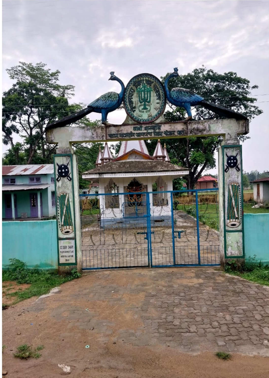
Head Office of Goalpara Jila Boro Baro Dal, Amjonga