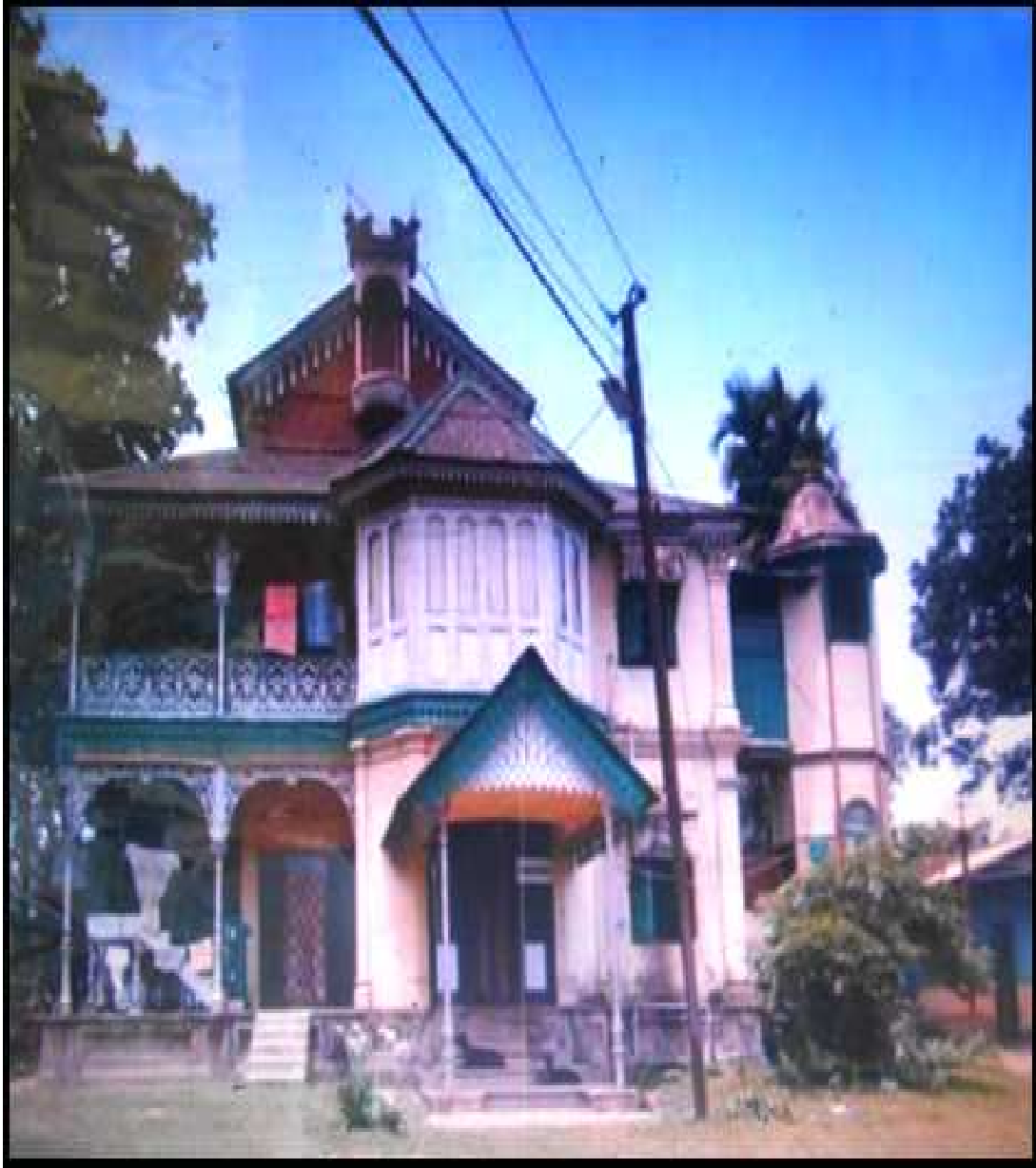
গৌৰীপুৰৰ মাটিয়াবগত অৱস্থিত গৌৰীপুৰ জমিদাৰৰ হাৰাখানা (ৰাজহাউলী)