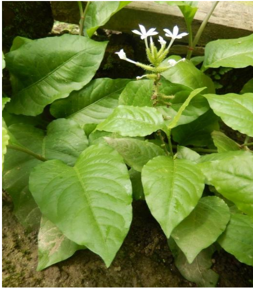
17. Plumbago zeylanica L.