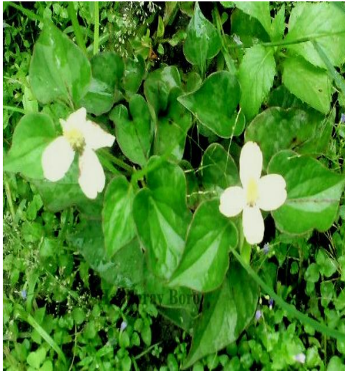
11. Houttuynia cordata Thunb.