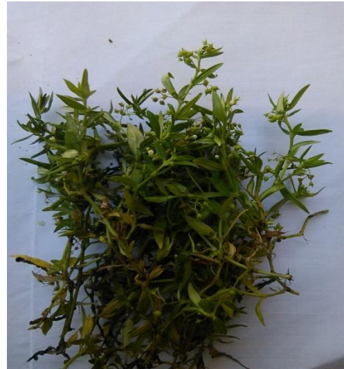
12. Mollugo pentaphylla L.