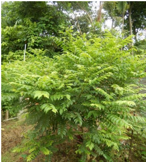
13. Murraya koenigii L.