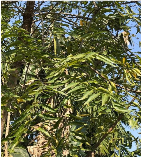
35. Azadiractha indica A.Juss.