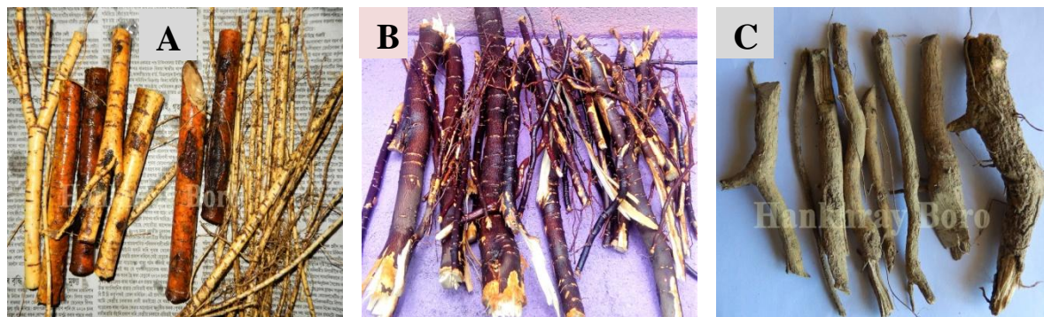
Root images of A. Morus indica , B. Averrhoa carambola & C. Phlogacanthus thyrsoiflorus .