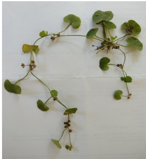
32. Centella asiatica (L.) Urb.