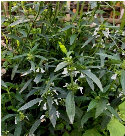
19. Leucas indica L.