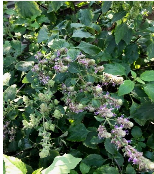
30. Pogostemon plectranoides Desf.