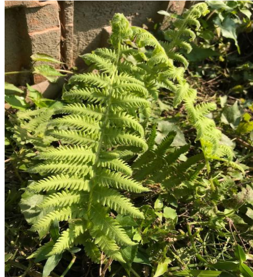
36. Amphineuron opulentum (Kaulf.)