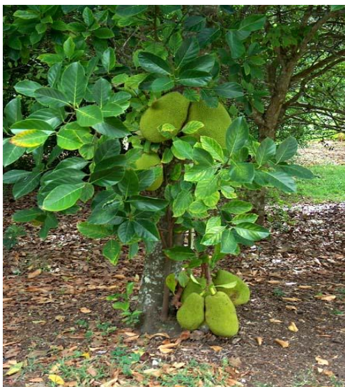
15. Artocarpus heterophyllus Lam.