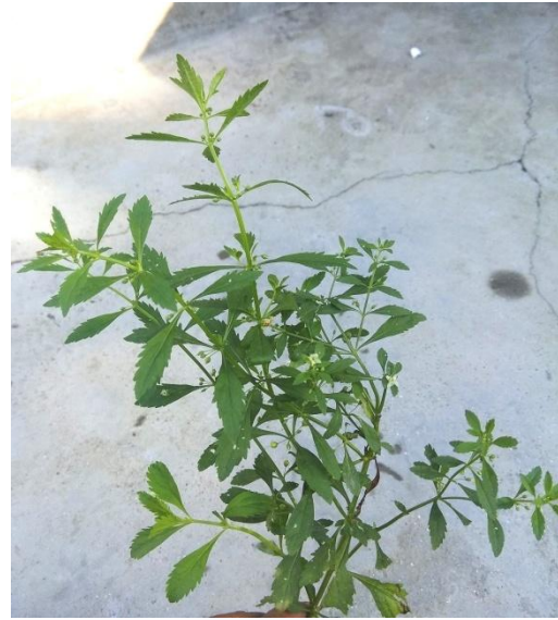
24. Scoparia dulcis L.