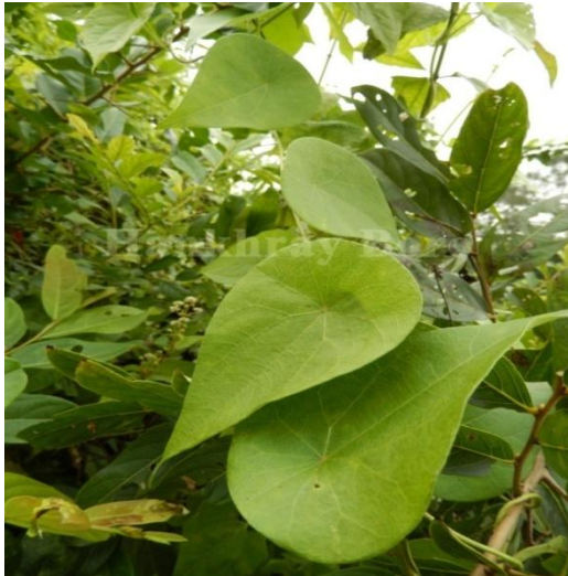
5. Stephania japonica Thunb.