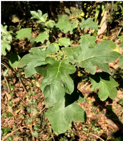
37. Solanum indicum L.