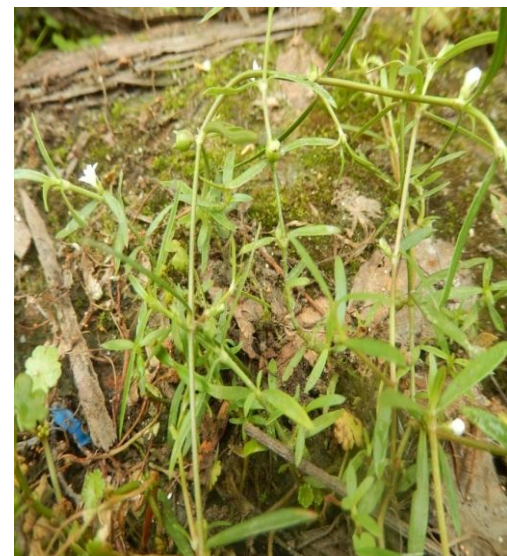
16. Oldenlandia diffusa (willd.) Roxb.