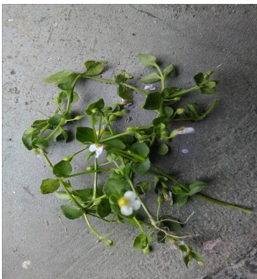
9. Stellaria media L.