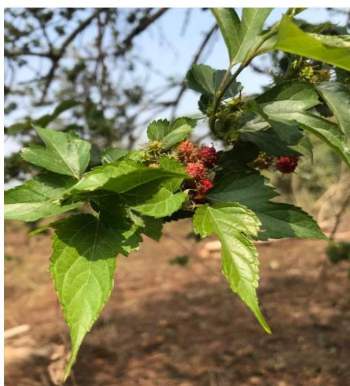
1. Morus indica L.