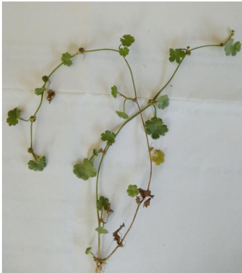
31. Hydrocotyle sibthorpioides Lam.