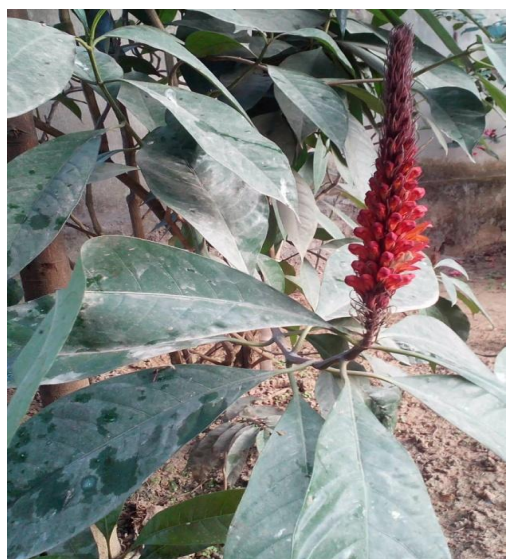
3. Phlogacanthus thyrsoiflorus Nees.