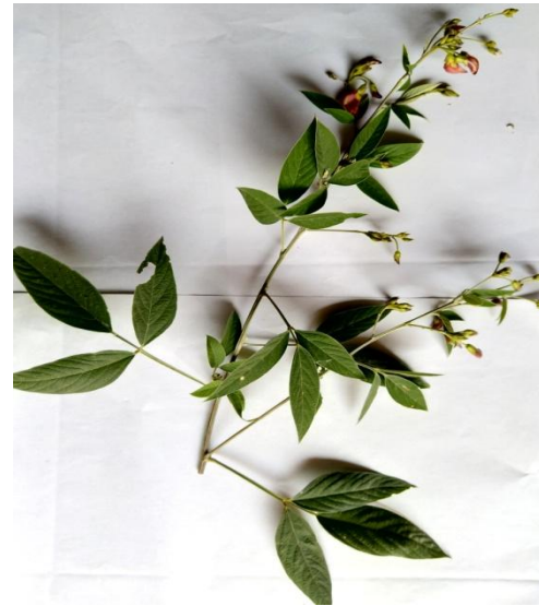
38. Cajanus cajan (L.) Millsp.