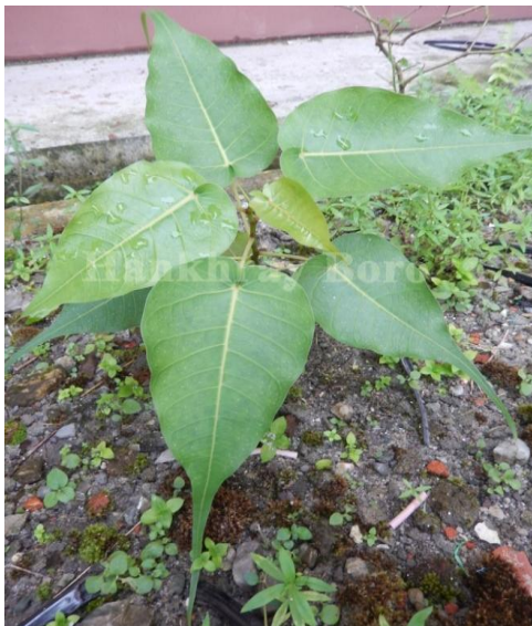
25. Ficus religiosa L.