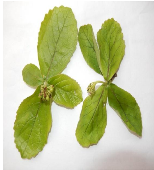
14. Premna herbacea Roxb.