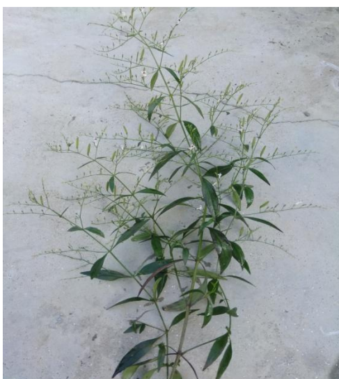
27. Andrographis paniculata Nees.