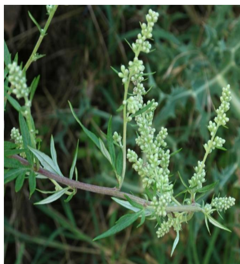
28. Artemisia vulgaris L.