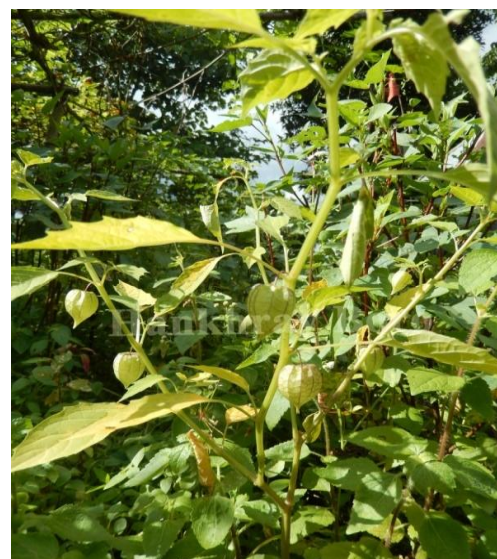
4. Physalis minima L.