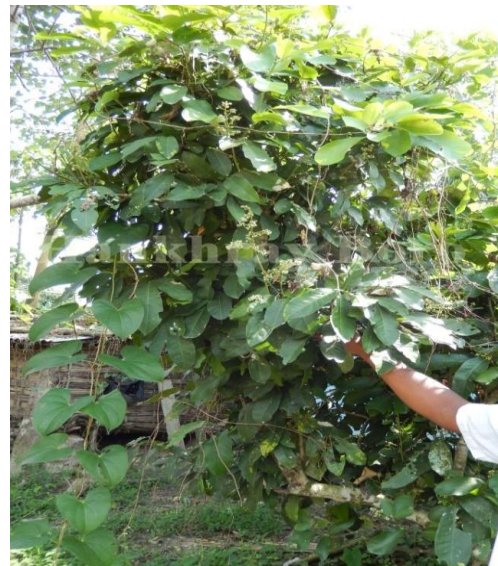
26. Glycosmis pentaphylla (Rets). DC.