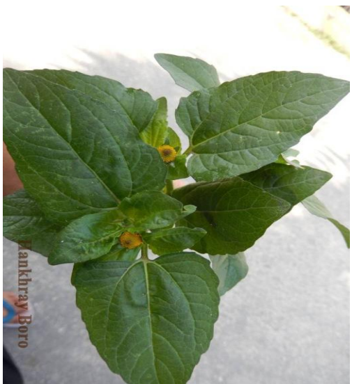
21. Spilanthes paniculata wall.ex DC.