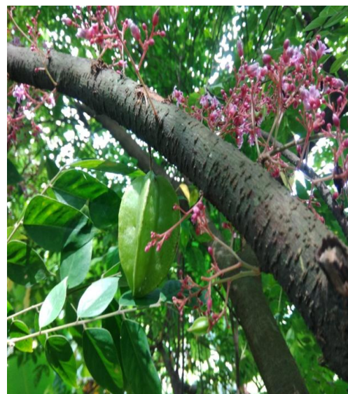
2. Averrhoa carambola L.