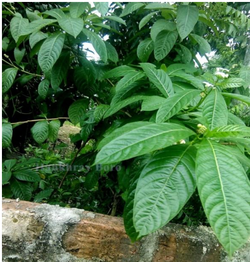
7. Morinda angustifolia Roxb.