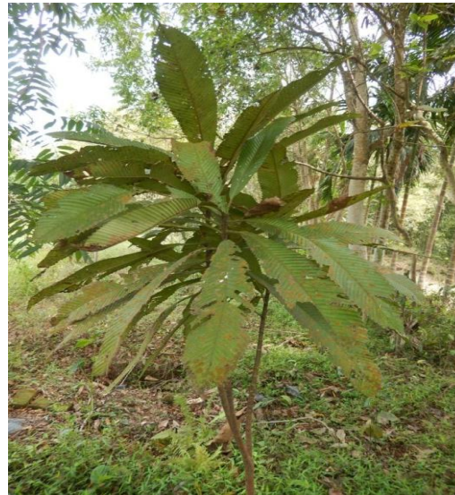
20. Dillenia indica L.