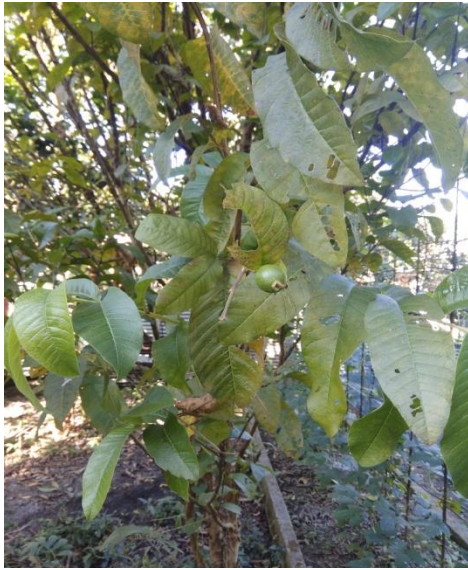
23. Psidium guajava L.