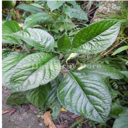
6. Clerodendrum cordatum D. Don.