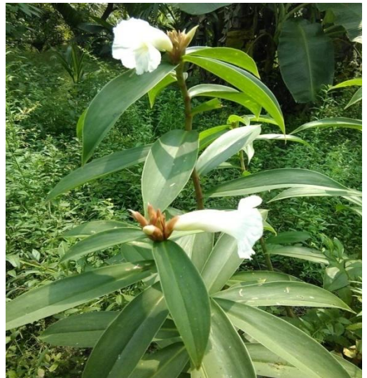
8. Costus speciosus (J. Koenig) Sm.