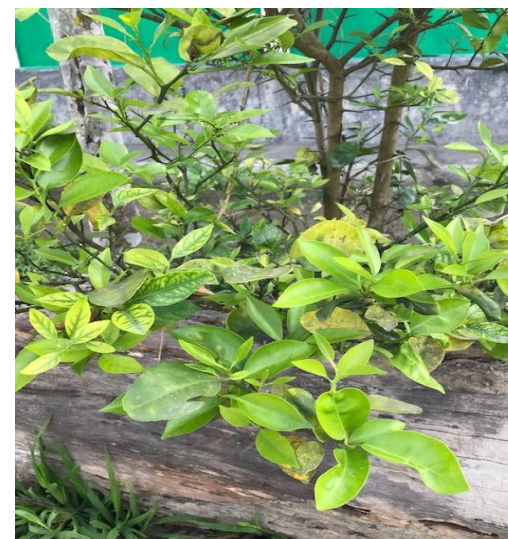
22. Citrus medica L.