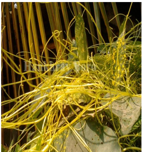
33. Cuscuta reflexa L.