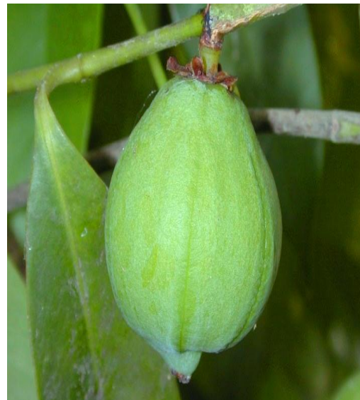
40. Garcinia cowa Roxb.