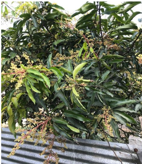
39. Mangifera indica L.