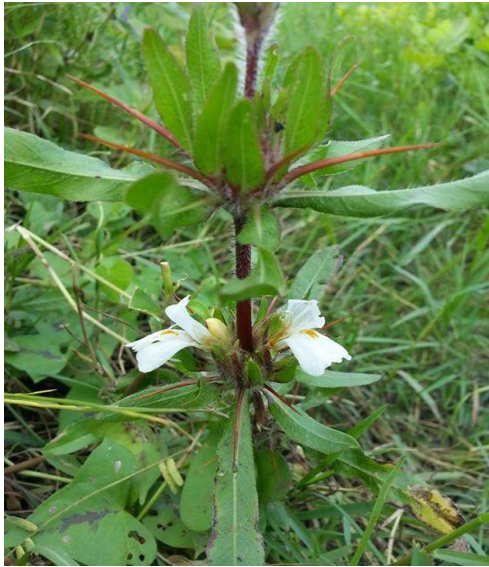
29. Hygrophila phlomoides Nees.