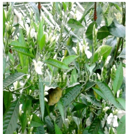
10. Justicia adhatoda L.